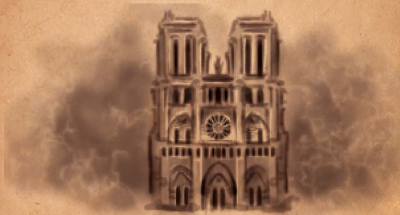
Catedral de Notre Dame

Até hoje os marcos revolucionários: Liberdade, Igualdade e Fraternidade norteiam a sociedade Ocidental.